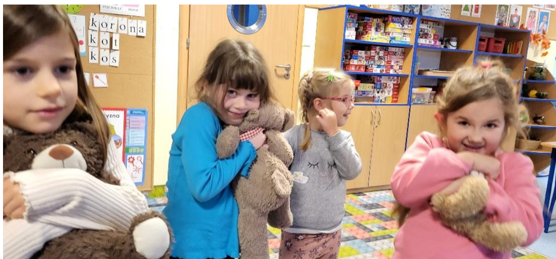
Starsze grupy uczestniczyły w zajęciach Sanepidu „Jak ochronić się przed kleszczami”